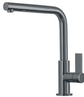
VERONA GUN METAL R497 S56