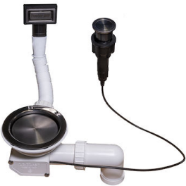
VIDAGE FADE PUSH GUN METAL A407 A20