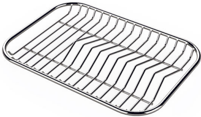
GRILLE PORTE-ASSIETTES INOX 25x35

* uniquement en combinaison avec l'accessoire A644 A01