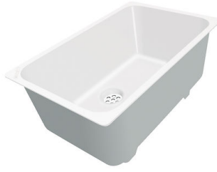
CUVETTE PLASTIQUE BLANCHE

* uniquement en combinaison avec l'accessoire A644 F04